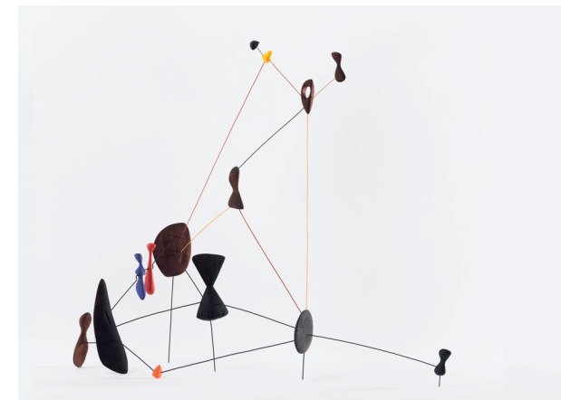
Alexander Calder (1898-1976) Constellation, 1943 Madera, alambre y pintura, 83,8 x 91,4 x 35,6 cm Calder Foundation, New York Calder Foundation, New York.

Calder-Picasso es la primera exposición en España dedicada a explorar los vínculos creativos entre estos dos maestros modernos del siglo XX: el norteamericano Alexander Calder (1898-1976) y el malagueño Pablo Picasso (1881-1973).