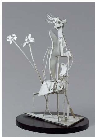
Pablo Picasso (1881-1973) Mujer en el jardín, primavera 1930 Hierro soldado pintado en blanco, 206 x 117 x 85 cm Musée national Picasso-Paris. Dación Pablo Picasso 1979. MP267 © Sucesión Pablo Picasso, VEGAP, Madrid, 2019