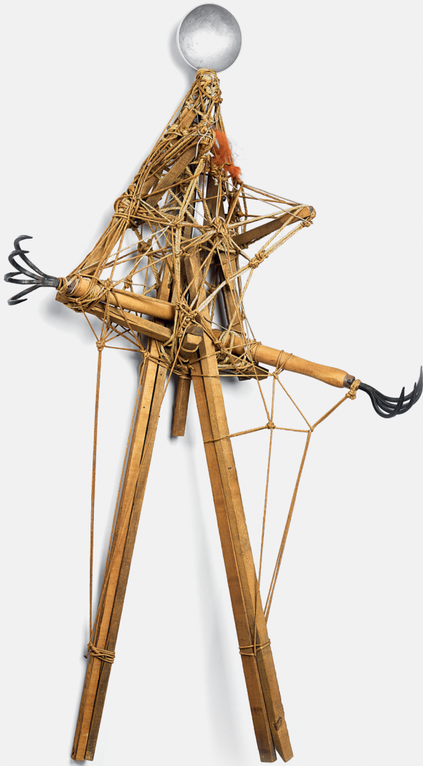
Pablo Picasso (1881-1973) Figura , 1935

Cuchara, ganchos, madera, cuerdas y clavos, 112 x 61,5 x 29,8 cm Musée national Picasso-Paris. Dación Pablo Picasso, 1979. MP316