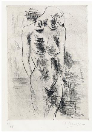
Georges Braque (1882-1963) Estudio de desnudo , 1907-1908 Aguafuerte, 56,5 x 38 cm Fondation Marguerite et Aimé Maeght, Saint-Paul-de-Vence, Francia