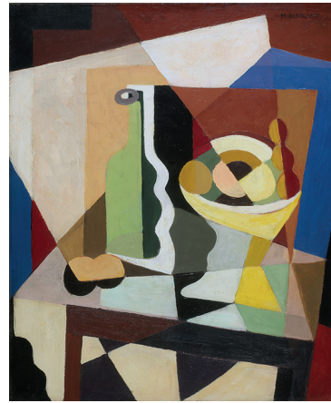
María Blanchard (1881-1932) Botella y copa de frutas sobre una tabla , ca. 1917-1918 Óleo sobre lienzo, 73 x 60 cm Colección Zorrilla Lequerica