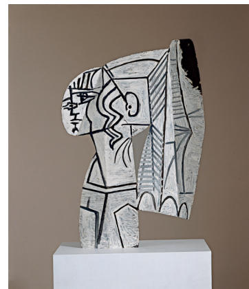
Fig. 3 Pablo Picasso Sylvette , Vallauris, 1954 Chapa recortada, doblada y pintada por ambas caras 69,9 x 47 x 0,076 cm Colección particular.

González. La fructífera reciprocidad de la relación que mantuvieron se refleja en las tres obras del propio González que aquí se exponen [fig. 2] y que, si por una parte miran hacia atrás, hacia el Picasso cubista, por otra presagian sus esculturas tardías de chapa recortada y doblada. Durante los años cuarenta y primeros cincuenta, Picasso utilizó piezas de chatarra en algunos de sus assemblages (esculturas realizadas combinando distintos materiales) –como, por ejemplo, la anilla y los clavos que aparecen en El vaso –, pero no volvió a hacer más esculturas de planos en hierro hasta que conoció a Tobias Jellinek y Sylvette David en 1954. Sylvette fue retratada no sólo en numerosos cuadros y dibujos, sino también en maquetas de cartón que Jellinek copiaba después en chapa y Picasso pintaba en blanco y negro [fig. 3]. Esta colaboración sería el modelo para otra posterior y más duradera, la que Picasso mantuvo con Prejger y su equipo de operarios en los primeros años sesenta.