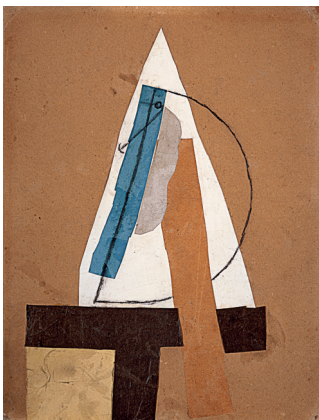
Fig. 1 Pablo Picasso (1881-1973) Cabeza/Tête , Céret, primavera 1913 Papel encolado, carboncillo y lápiz sobre cartón, 43,5 x 33 cm Scottish National Gallery of Modern Art. Purchased with help from the National Heritage Lottery Fund and The Art Fund, 1995