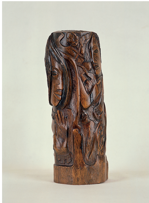
Paul Gauguin La siesta de un fauno Ca. 1892 Cilindro de madera tamanu, 35,6 x 14,7 x 12,4 cm Colección Musée départemental Stéphane Mallarmé, Département de Seine-et-Marne

En la Pequeña figura original, Picasso empleó alfileres metálicos para los ojos, como en ciertas esculturas africanas, y también pintó la madera toscamente tallada.