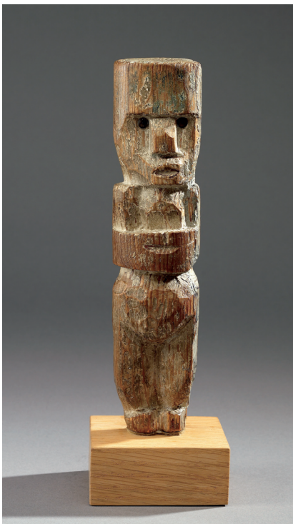
Pablo Picasso Poupée París, 1907 Madera, alfileres de latón, restos de óleo y gesso, 23,5 x 5,5 x 5,5 cm Art Gallery of Ontario, Toronto

Ésta es la primera de una serie de exposiciones sobre obras de la Colección del Museo Picasso Málaga cuya finalidad es situarlas en el contexto del arte de Picasso y de sus contemporáneos. El bronce Pequeña figura se hizo a partir de un original de madera que Picasso había tallado en 1907, por las mismas fechas en las que trabajaba en una pintura revolucionaria, Las señoritas de Aviñón . Años después recordaría que una visita a las colecciones etnográficas del Trocadéro de París, donde vio máscaras tribales y fetiches por primera vez, había tenido un gran impacto en su obra, y en aquella época había afectado a todo su planteamiento artístico.