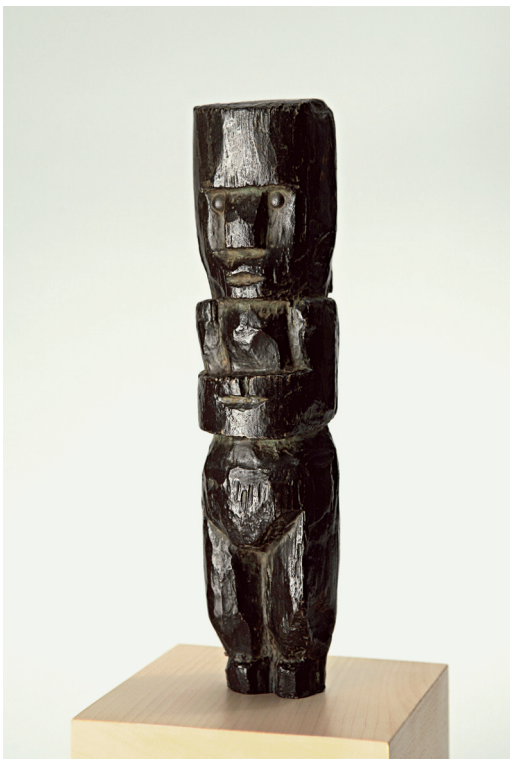
Pablo Picasso Pequeña figura París, 1907 (fundida en 1964) Bronce, 23,5 x 5,5 x 5,5 cm Museo Picasso Málaga

Pequeña figura es la única obra de la serie de tallas de madera hechas por Picasso en 1907 que fue fundida, y la última escultura suya que se fundió en vida del artista. La transformación del material, de tosca madera tallada a metal pulimentado, añade a la pieza una dimensión de permanencia y presencia formal que permite ver en ella una escultura tardía de Picasso, con independencia del contexto temprano en el que se esculpió el original lúneo. El bronce del Museo Picasso Málaga es el primer ejemplar de una edición de doce, cada uno de los cuales fue acabado con una pátina diferente. Pequeña figura , conservada por el propio artista hasta su muerte, pasó a formar parte de la Colección del Museo en 1998, por donación de Christine Ruiz-Picasso.