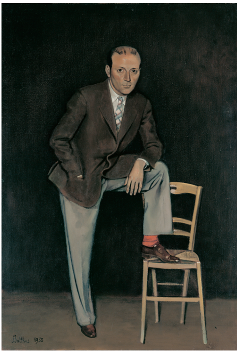
Balthus (1908-2001) Pierre Matisse, 1938 Óleo sobre lienzo, 130,2 x 88,9 cm The Metropolitan Museum of Art, Nueva York. The Pierre and Maria-Gaetana Matisse Collection, 2002 (2002.456.7)

Son los artistas quienes protagonizan la historia del arte, pero en el destino de su obra influyen, en parte, otras personas: personas que trabajan "entre bastidores" y que, maniobrando en la intrincada dinámica del mundo del arte, determinan la visibilidad del artista y, en ocasiones, su "importancia".