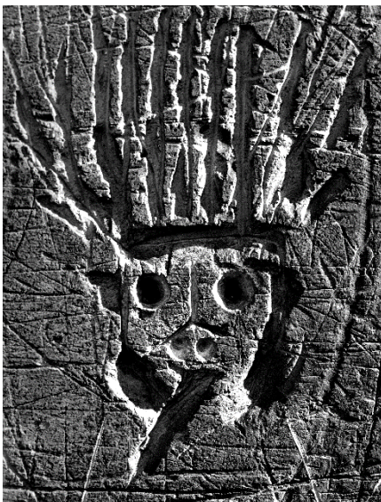
02. Brassaï (1899 - 1984) Serie «Graffiti». El rey Sol, París, 1930-1950 Gelatina de plata, 40 x 29,5 cm Estate Brassaï Succession, Paris