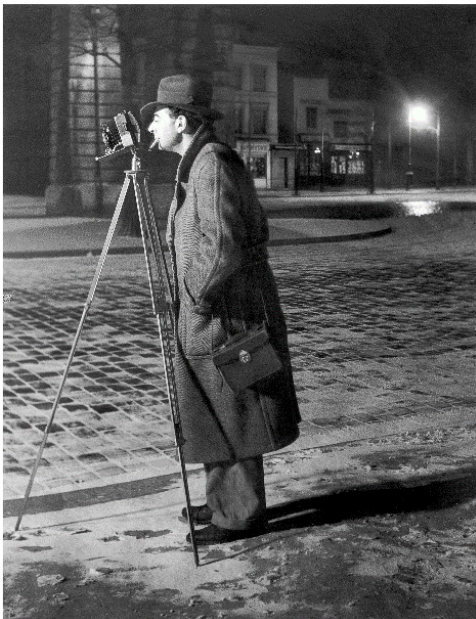
04. Brassaï (1899 - 1984) Autorretrato en el bulevar Saint-Jacques, París, 1930-1932 Gelatina de plata, 29,6 x 22,9 cm Estate Brassaï Succession, Paris