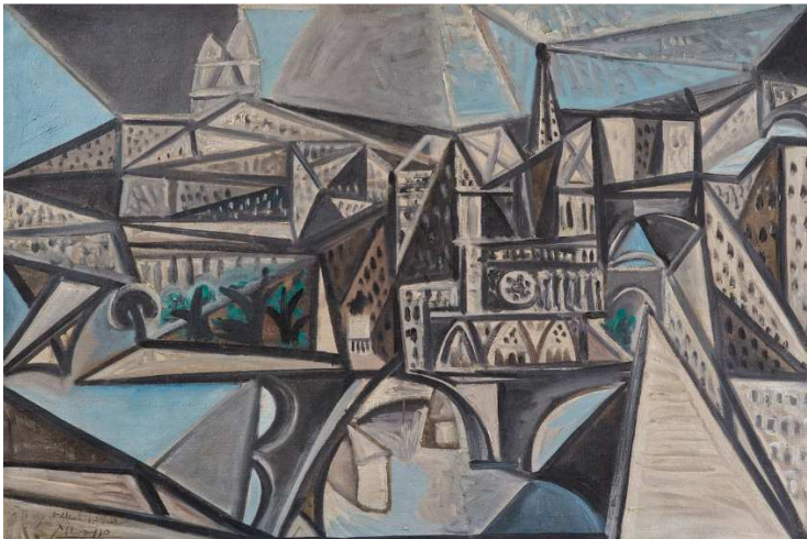
10. Pablo Picasso (1881 - 1973) Ile de la Cité - vista de Notre-Dame de Paris París, 26 febrero 1945 Óleo sobre lienzo, 80 x 120 cm Museum Ludwig, Colonia © Sucesión Pablo Picasso, VEGAP, Málaga, 2021