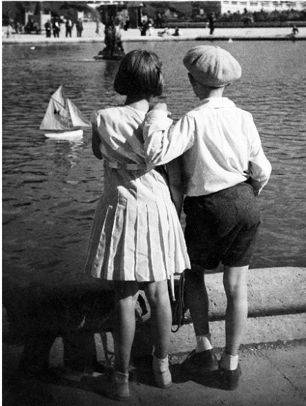
03. Brassaï (1899 - 1984) Estanque de los jardines de Luxemburgo, París, 1930 Gelatina de plata, 29,6 x 22,3 cm Estate Brassaï Succession, Paris