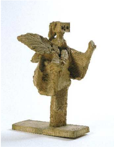
11. Pablo Picasso (1881-1973) Mujer con follaje, Boisgeloup, 1934 Yeso original barnizado, 38,5 x 27,5 x 21 cm Fundación Almine y Bernard Ruiz-Picasso para el Arte, Madrid. Préstamo temporal en el Museo Picasso Málaga