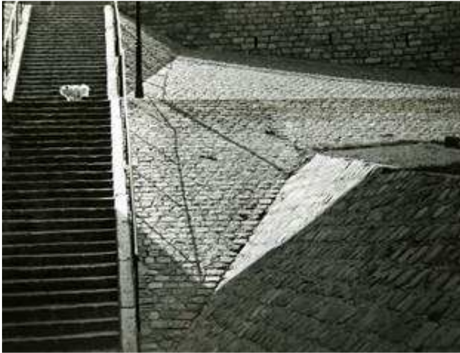
09. Brassaï (1899 - 1984) Escaleras de Montmartre con perro blanco, París, 1932 Gelatina de plata, 30 x 40 cm Estate Brassaï Succession, Paris